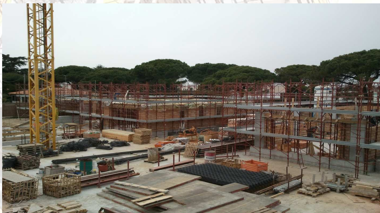
Figura 1 : Vista del cantiere