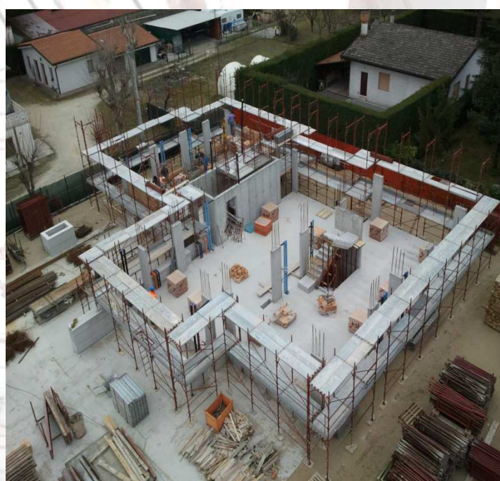
Figura 3 : ponteggio in elevazione