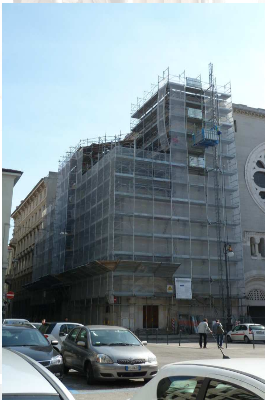
Figura 1 : Ponteggio Via Zanetti

Tipologia : Ponteggio per il restauro. Marchio : Ponteggio a telaio TEL-DAL Marcegaglia – Montacarichi Maber MB C 1000 Sviluppo : Ponteggio a telaio TEL-DAL Marcegaglia mq 2000 – struttura in giunto-tubo 3000 giunti Obiettivo : Consolidamento delle tre cupole della Sinagoga. Soluzione : Allestimento di un ponteggio di servizio in telaio posato su una struttura di sostegno in giunto-tubo necessaria a intervenire alla sostituzione del manto delle cupole. La struttura è stata completata con montacarichi Maber MB 1000 C adibito al trasporto di cose e persone