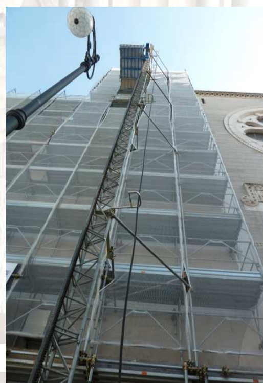
Figura 2 : Montacarichi Maber MB C 1000